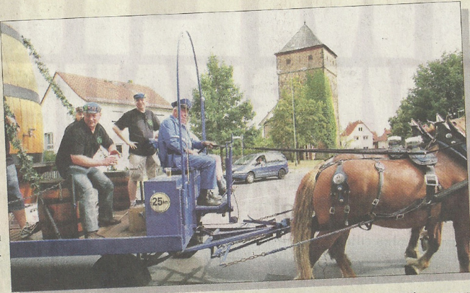
„Die Poart“ ist das Wahrzeichen des Gießener Stadtteils Wieseck. Der Kirmesumzug führt natürlich auch wieder an der Pforte vorbei.

Im Gegensatz zum Vorjahr startet die „Kerb“ in diesem Jahr bereits am Freitag, 5. August, um 19 Uhr mit einem Fasanstich im Biergarten, der wie-